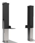
ELS420 Système de levage électrique pour CT420