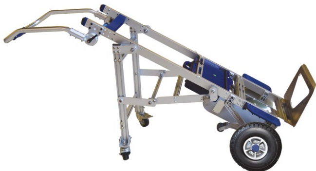
DME170/E-OP007 Béquille brancard