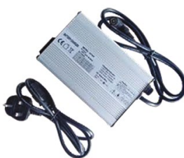
DME170/E-PD003 Chargeur standard