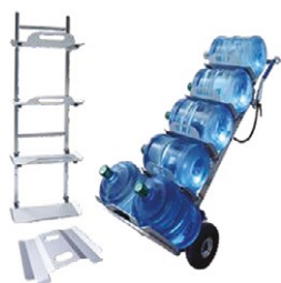
DME170/E-OP008 Porte bonbonnes d'eau