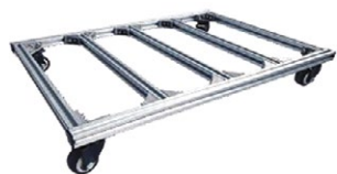
DME170/E-OP006 Châssis roulant 550x400 mm