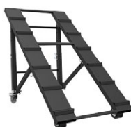
CT420RAMP Rampe pour CT420