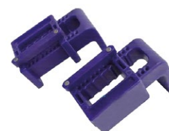
SBH Crochets de maintien pour bacs