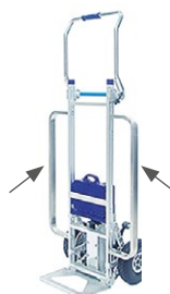
DME170/E-OP003 Extension latérale