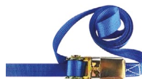
DME170/E-PD004 Sangle de sécurité