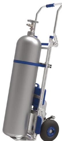
DME170/E-OP002 Equipement double porte-bouteille