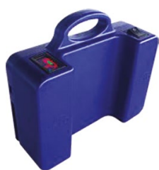
DME170/E-PD002 Batterie supplémentaire